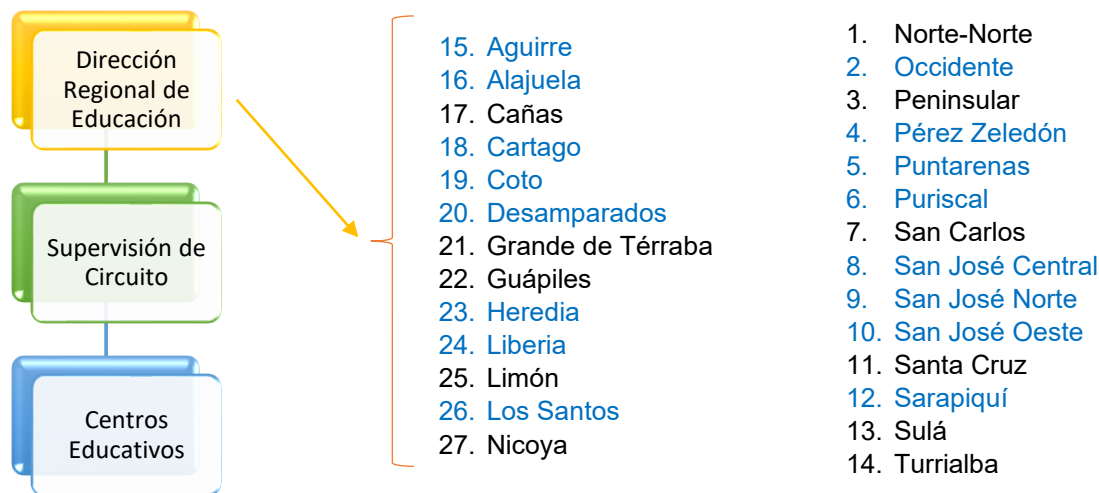
Figura N° 2: Ubicación jerárquica de las Direcciones Regionales de Educación

A fin de brindarle un mejor servicio, recuerde que puede verificar en la Dirección Regional de Educación correspondiente, la solicitud de las distintas licencias y permisos, las cuales puede consultar en el siguiente enlace: https://dgth.mep.go.cr/servicios-ofrecidos-por-dre/ .