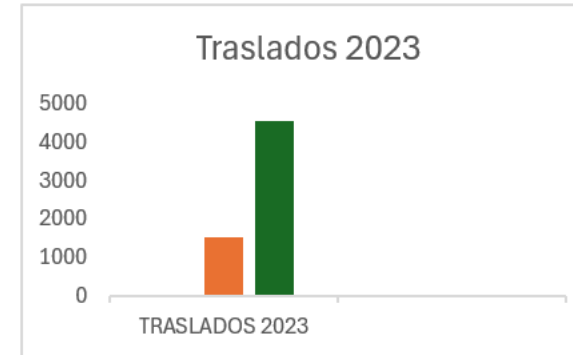
Cuadro 5: Resultados de SALTAD para el 2023