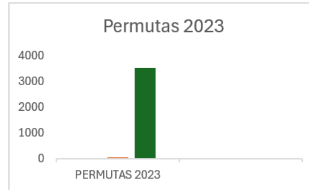
Cuadro 4: Resultados de SALTAD para el 2023