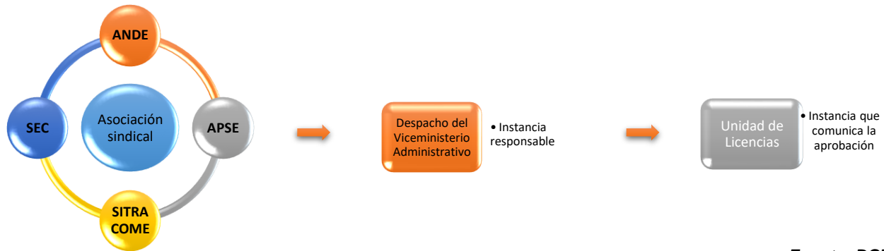
Figura N° 2: Instancia responsable del trámite

La instancia responsable de este trámite es el Despacho del Viceministerio Administrativo del MEP, siendo que inicialmente la persona solicitante debe de remitir los requisitos a su respectiva asociación sindical.